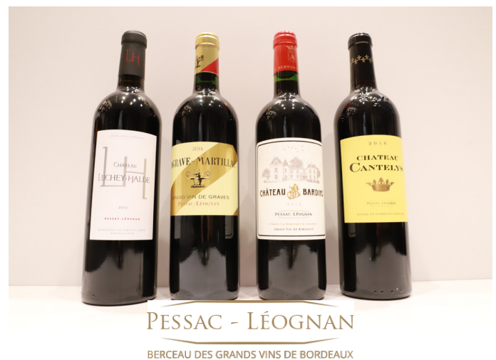
Château Bardins rouge 2015 - 23,00 € Château Cantelys rouge 2016 - 23,50€ Lagrave-Martillac rouge 2015 - 23,00 € Château Luchey-Halde rouge 2012 - 24,00 €