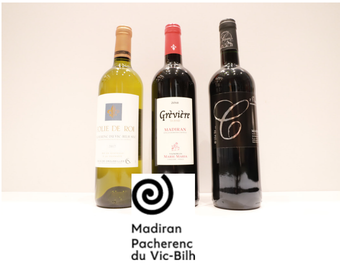
Vignoble Marie-Maria Madiran Grevière- 12,45 € Domaine du Crampilh l'Original - 8,50 € Cave de Crouseilles Folie de Roi - 6,70 €