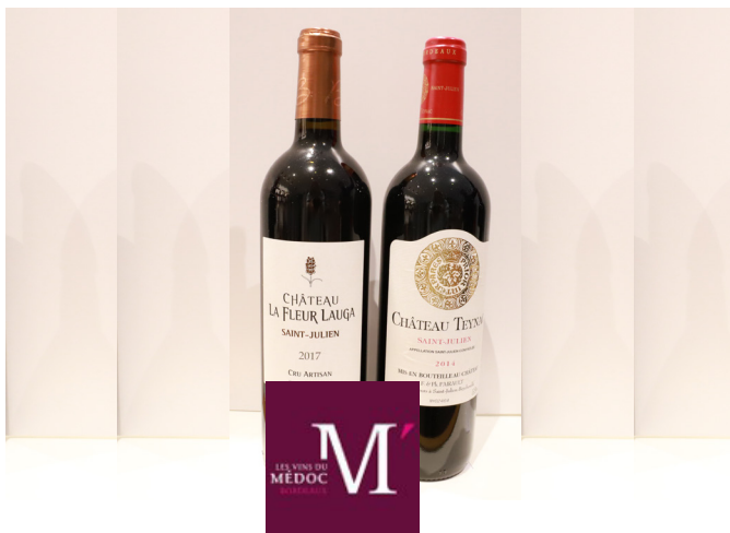
St Julien Château de Lauga - 35,00 € St Julien Château Teynac 2014 - 32,50 €