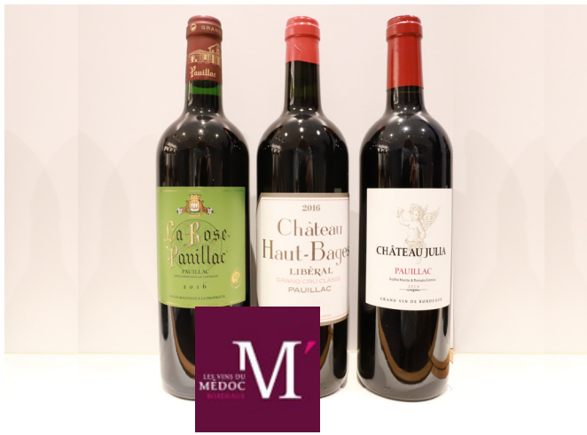
Pauillac Château Julia 2018 - 30,00 € Pauillac Château La Rose Pauillac 2016 - 22,50 € Pauillac GCC 1855 Château Haut-Bages Libéral 2016 - 63,00€