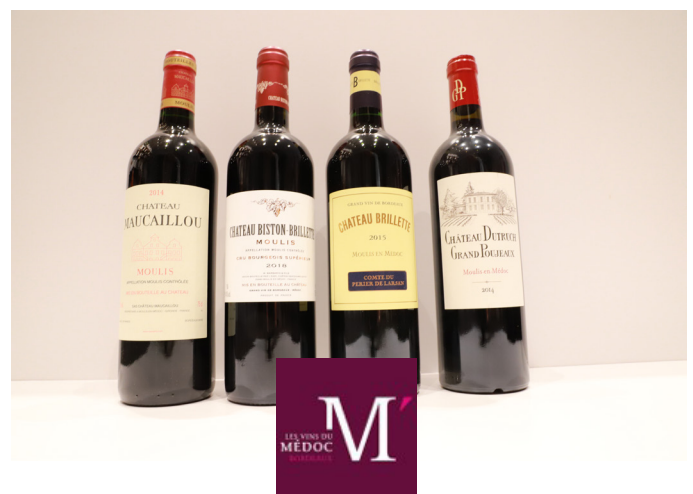
Moulis Chateau Brillette 2015- 18,00 € Moulis Chateau Maucaillou 2014 - 25,10 € Moulis Chateau Biston-Brillette - 16,75 € Moulis Chateau Dutruch Grand Poujeaux 2014 - 15,00 €