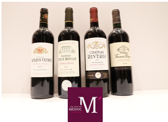
Llistrac Chateau Fourcas-Dupré 2018 - 17,00 € Llistrac Chateau Cap Léon Veyrin - 18,00 € Llistrac Chateau du Vieux Moulin - 15,00 € Llistrac Chateau Reverdi 2014 - 15,00 €