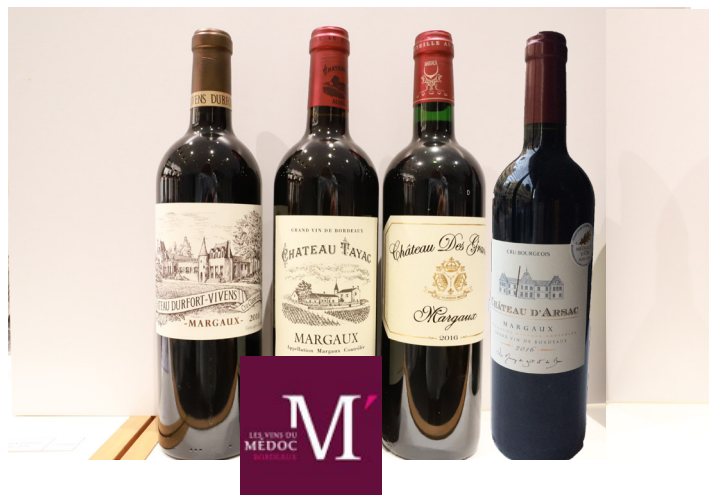
Margaux GCC 1855 Chateau Durfort-Vivens 2016 - 79€ Margaux Chateau Tayac 2016 - 23,00 € Margaux Chateau des Graviers - 26,00 € Margaux Chateau Arzac 2016 - 22,00 €