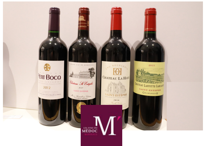
St Estèphe Château la Haye 2016 - 27,00 € St Estèphe Château Arnaud -20,00 € St Estèphe Château Lafitte Carcasset 2015- 21,00 € St Estèphe Château Petit Boco 2012 - 25,00 €