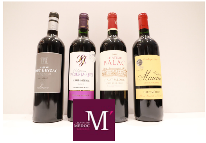
Haut-Médoc Chateau Balac 2016- 12,00 € Haut-Médoc Chateau Haut-Beyzac - 15,50 € Haut-Médoc Chateau Lacour-Jacquet 2012 - 13,00 € Haut-Médoc Chateau Maurac 2016 - 15,00 €