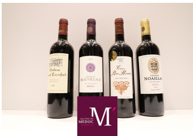
Médoc Chateau Beauvillage - 12,20 € Médoc Chateau Gadet Terrefort - 8,70 € Médoc Chateau Bejac Romelys 2016 - 11,00 € Médoc Chateau Noaillac 2016 - 11,80 €