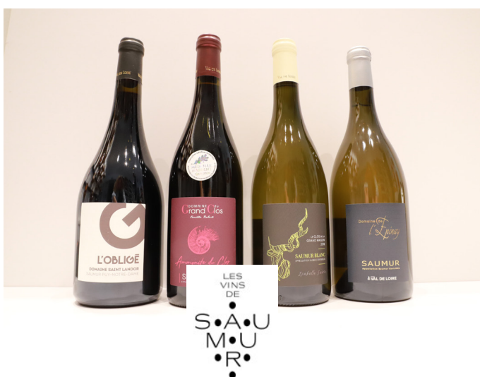
Domaine du Grand Clos 2018 - 6,00 € Puy Notre Dame 2017 - 11,00 € Clos de la Grand Maison 2018 - 12,00 € Domaine de l'Épinay - 8,90 €