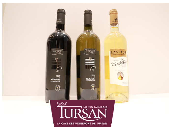
Moelleux impératrice - 5,10 € Cœur de vigneron blanc sec - 6,25 € Cœur de vigneron rouge - 6,25 €